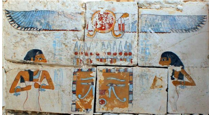
Geschilderde scène van de godinnen Neith en Noet in de tombe van Senebkay, Abydos

Deze vondst versterkt de theorie van de Deense egyptoloog Kim Ryholt. Hij kwam halverwege de jaren negentig met een spraakmakende theorie over een tot dan toe onbekende 14 de dynastie in Abydos, die hij uiteenzette in zijn boek: “The Political Situation in Egypt during the Second Intermediate Period c. 1800-1550 B.C.” .